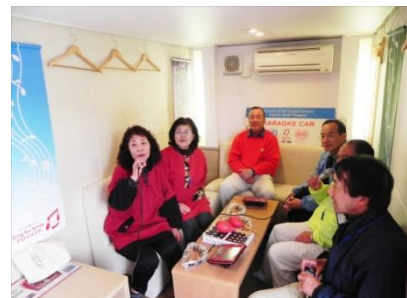
カラオケカーを利用して交流を深めました