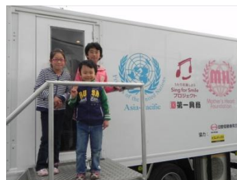
カラオケカーを楽しみに待っていた子供達