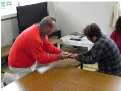
一人一人に励ましの言葉を掛けました