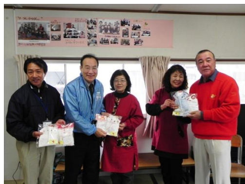
感謝の気持ちが込められた手作りタオルを頂きました