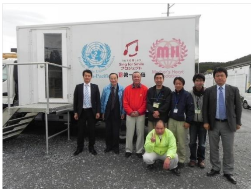
仮設にお住まいの方々が無料で使用出来るカラオケカー