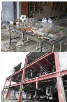
復旧の進まない沿岸地域

特にコミュニケーション不足が目立つ男性高齢者に対し、“脳と心の活性化”を図るには、男性高齢被災者の心に英気を与えるきっかけ作りとして、元々野球の盛んな地域であること、また対象世代にとって“プロ野球”が最も身近なプロスポーツであることから、国連の友医師団の要請と被災地からの要望を受け、日本プロ野球名球会が活動に参加することになりました。