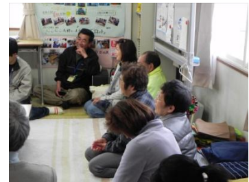
和やかな雰囲気の中、仮設入居者の皆様との談話が行われました