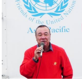
オープニングセレモニーには多くの仮設入居者の方々が集まりました